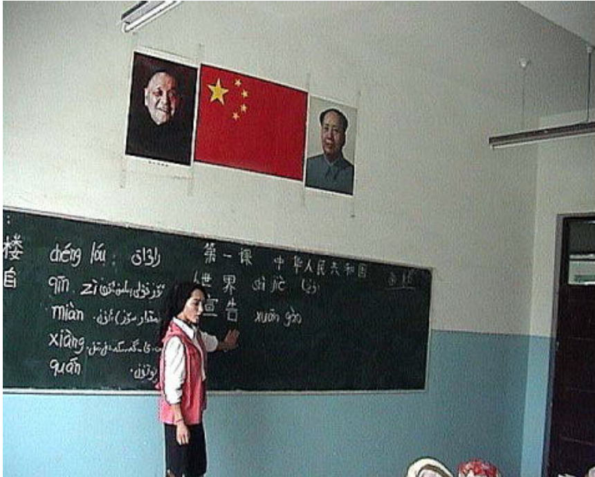
(ホータンでの中国語の授業)

個人のアイデンティティが、このように、いつもどこでも同じであらねばならないというのは欧米的な観念である。