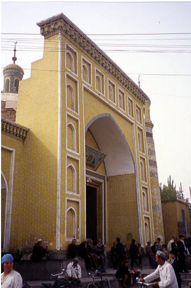
(カシュガル、エイティガール・モスク)

現地の有力者（ベク）に統治を任せ、大きな変化はなかった。19世紀の後半、新疆では反乱が続出し、ロシア、英国などの列強が中国侵入をうかがうなかで、新疆省が成立し、同化政策に転じた。これは民族の自覚を促し、1921年にウイグルという民族名が採用された。