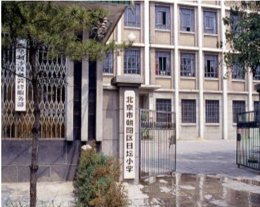
(北京市内の小学校)

ではなぜ民族間の差別や偏見が生まれるのか。「別の種に属すという知識が他民族を区別し、ごく微妙な差異を民族・人種の種差として事後的に知覚させ、指標のとり方で、差別の対象になる。民族は体験される差異によって差別されるのではなく、差異を経験にもたらしするための民族や国民といったそれ自身は経験できない実定性が先入観として働くときに差別される。